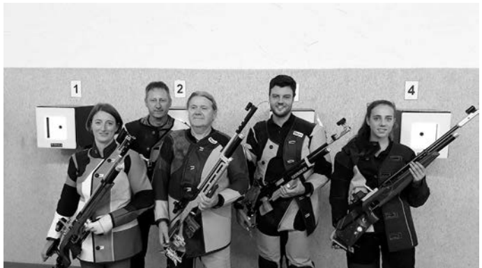
1. Luftgewehr Mannschaft SV Willmandingen

Am darauffolgenden Tag, Sonntag, den 1.12., folgen dann die Wettkämpfe der 1. Luftpistolenmannschaft gegen die Mannschaften aus Aalen und Ötlingen. Der erste Kampf beginnt bereits morgens um 10 Uhr, die Halle ist ab 9:00 geöffnet. Es findet eine ganztägige Bewirtung statt.