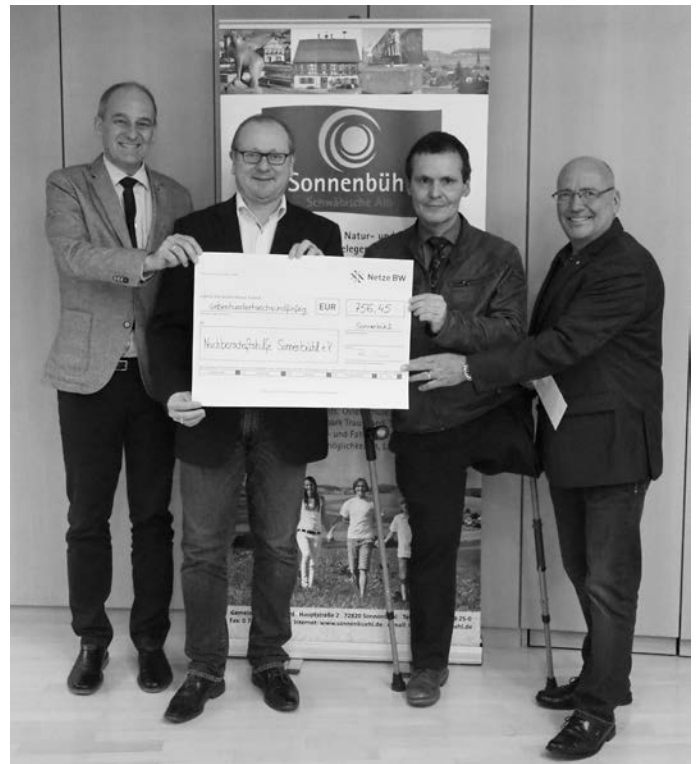
Spendenübergabe Netze BW an die Nachbarschaftshilfe Sonnenbühl